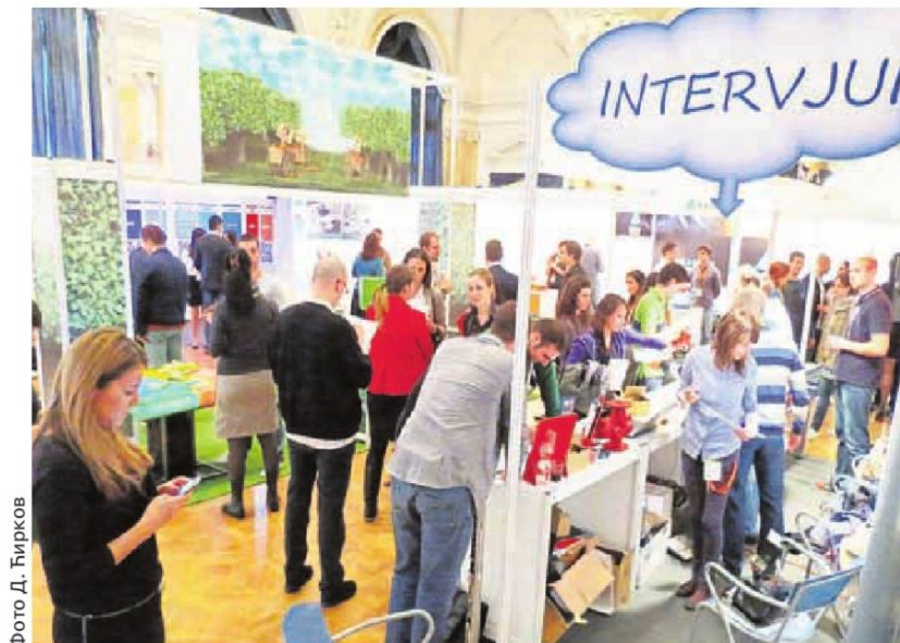
У згради техничких факултета у Булевару краља Александра

Данас до 18 часова биће отворен „JobFair13”